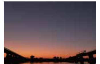
写真は「大好き！宮川流域 思いフォト募集」 及び「宮ルネフォト募集」応募作品