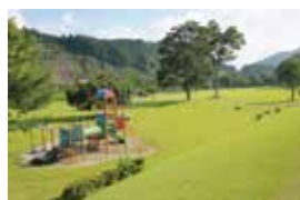
度会町 宮リバー度会パーク