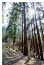
大紀町 熊野古道 ツヅラト峠